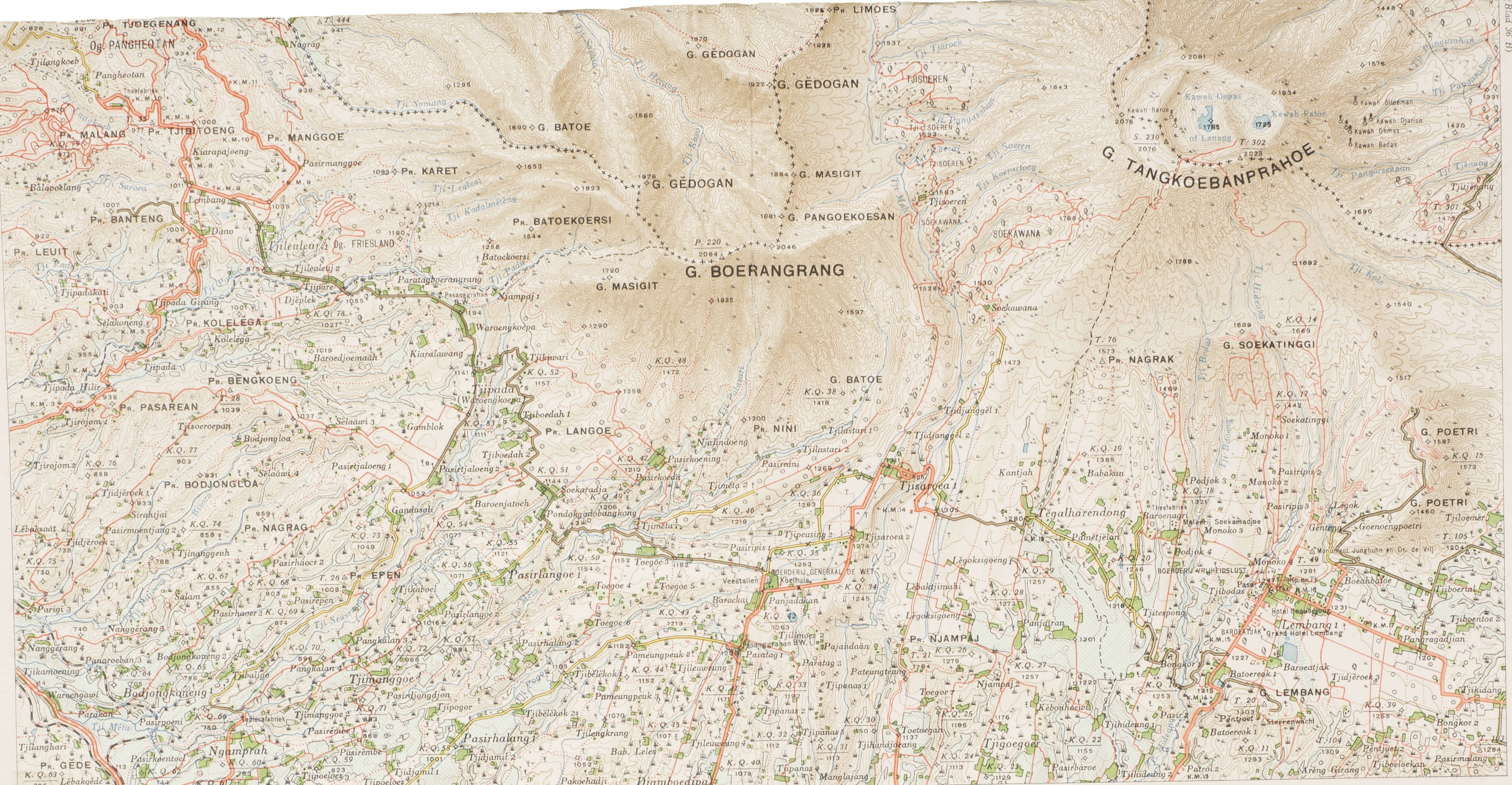
Topografische Inrichting, Batavia 1923.