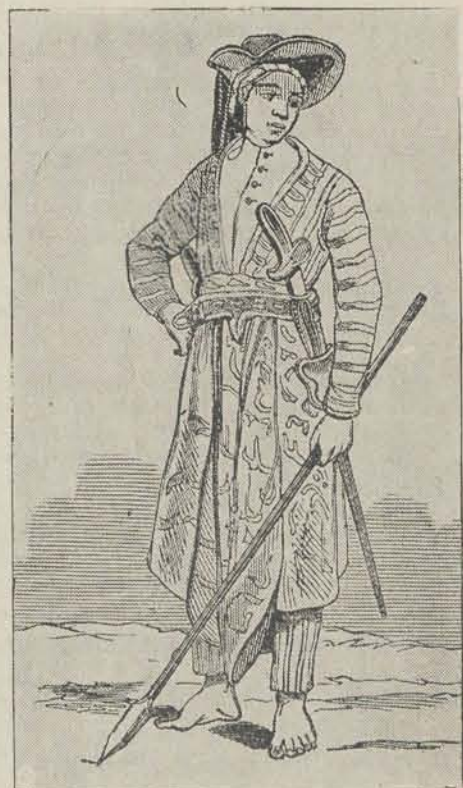
EEN JAVAAN IN HOFKOSTUUM.

Foei, meisje! foei, zoo naakt en bloot, En dansend om en om te zweven, Dat kunstje geeft u ligt den dood, En o! hoe kost'lijk is het leven! En schoon de mode 't u gebiedt, Denk toch er aan: het past zoo niet.