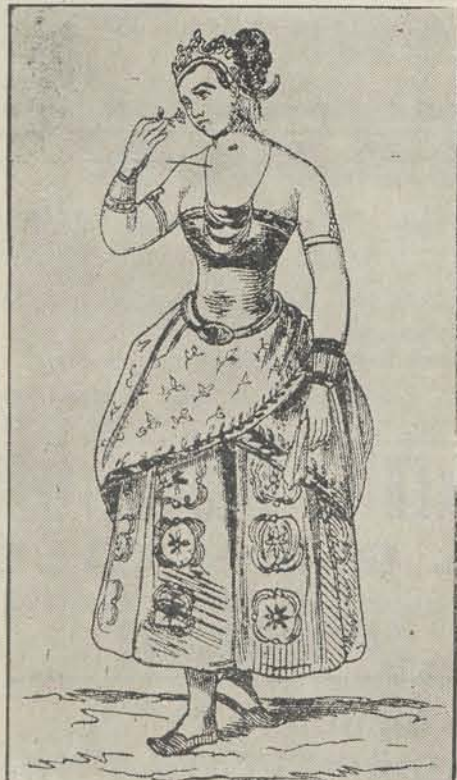
EENE JAVAANSCH VROUW UIT DEN VOORNAMEN STAND.

Hoe spreidt natuur haar pracht ten toon! Zij paart het goede aan 't rijkste schoon, Op Java wellen milde bronnen, Waaruit genot en duurzaam nut Door noesten ijver wordt geput En rijke welvaart is gewonnen. Daar wast aan iedre boom of plant Een gouden vrucht voor Nederland.