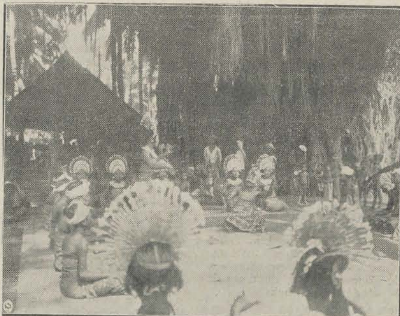
Man in het midden met religieuze dans Den Pasar, er omheen mannen met hoofddoek en meisjes met hoofdtooi. Op den achtergrond de nat. relig. gamelan.

We rijden meer naar het noorden. De weg stijgt. Spoedig komen weer de bergplanten, o.a. de smalbladige Javaansche edelweiss, die wij al leerden kennen bij Brastagi en het Tobameer. Over deze kolossale uitgestrektheid komt dus ongeveer dezelfde flora voor. Als heggan weer veel de mooie