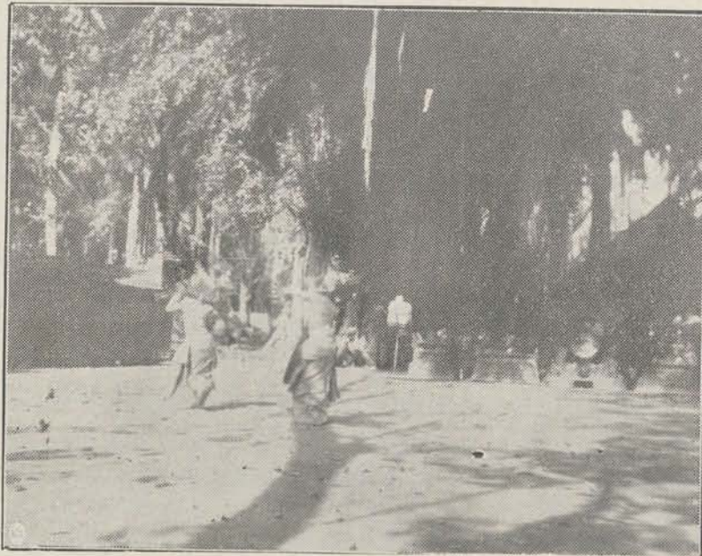
Houding uit de religieuze dans Den Pasar.

Poinsettia pulcherrima, met de roode topbladeren. Adelaarsvarens zijn ook hier weer in groote getale aanwezig. De z.g.n. vlier (Eupatorium) die op Java zoo algemeen is geworden, ontbreekt hier nog voor zoover ik kan zien. Klappers ontbreken ook op deze hoogte. Leuke pakpaardjes komen we tegen, beladen met rijst en met mais. Enkele mannen en vrouwen vertoonen duidelijk een krop. Wij rekenen uit dat wij op Bali zeker een 500 K.M. zullen afleggen en dus het eiland vrijwel geheel doorkruisen. Het prachtige bergmeer Batoer trekt onze aandacht. We trachten ons een voorstelling te vormen van het ontstaan. Minstens drie groote ringvormige kraterwallen loopen binnen elkaar. Binnen dezen grooten kraterwand ligt ook het meer. Binnenin de krater is een nieuwe top gekomen (dus eenigszins als bij de Bromo) en deze heeft in Aug. 1926 een groote lavastroom uitgeworpen, die nu nog als een zwarte massa zich afteekent op de helling. Een der nevenkraters rookt nog steeds. Bij een vorige eruptie was de tempel blijven staan, daarom wilden de menschen nu de plaats niet verlaten. Tallozen werden toen gedood.