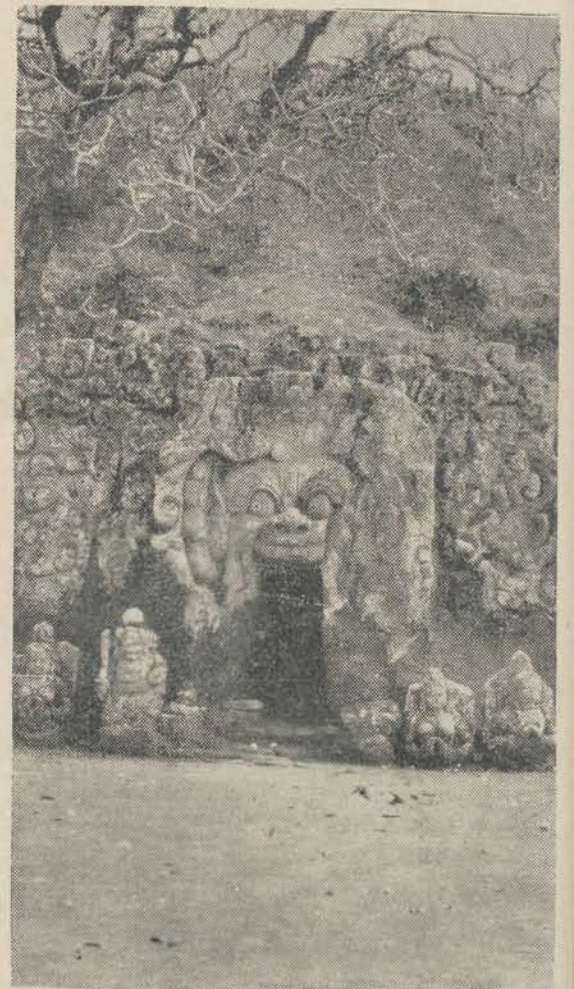
Olifantgrot met hindoe-oudheden. Kop is van Promo zonder onderkaak.

Dat het volk godsdienstig is blijkt ook uit het feit, dat men veel omgebogen bamboestengels op de erven ziet, met aan het einde gehangen de offergaven. Ook bij de huispoorten vindt men dikwijls plankjes met bloemen die aan de goden geofferd zijn. De Boeddhistische oude beelden zijn gewoon in hun eeredienst opgenomen, de Hindoe priesters (pedanda's) wijden de tempels door Sanskrietformulieren (weda's) maar de tempelwachters (pemangkoe) vormen de echte oude inheemsche priesterstand en zij weten ook de plaatsen en namen der goden in