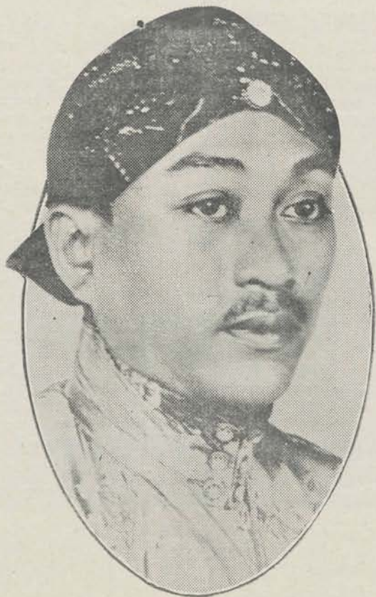
Z. H. Pangéran Adipati Ario Mangkoe Nagoro de Zevende.

Het meest persoonlijk (en dus ook: het belangrijkste!) is de vorstelijke schrijver in het hoofdstuk, dat handelt „Over de Semadi als mystieke daad”. Dit woord „semadi”, dat niet geheel door het in ons land welbekende woord