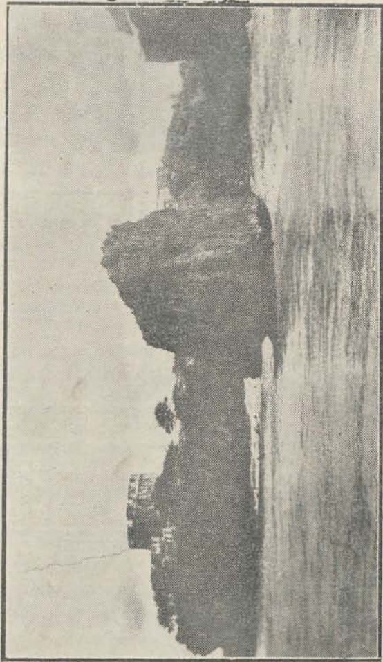
Curacao. — Fort Beekenburg, aan de Caracásbaai, gesticht tijdens het bestuur van den Directeur Nicolaas van Beek (1701—1704). Het fort diende in den Compagniestijd tot bescherming der baai, na St. Annabaai en Schottegat de belangrijkste. Op den voorgrond een eigenaardig gevormd rotsblok, de „grenadiersmuts” genoemd. Aan de Caracásbaai ligt het quarantaine-etablissement.