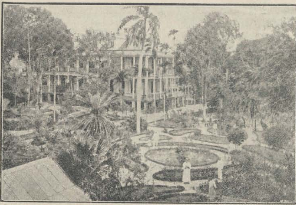
HET MILITAIR HOSPITAAL TE PARAMARIBO.

Deze inrichting met haar fraaien tropischen tuin, groot ± 2 H.A. is oorspronkelijk opgericht voor de militaire bezetting; zij herbergt thans meer burgerzieken. Aan het hoofd staat een officier van gezondheid 1ste klasse, terwijl daaraan verder verbonden zijn drie officieren van gezondheid 2e klasse en twee burgergeneesheeren, een militair apotheker en een burger apotheker. Aan de in het hospitaal gevestigde Geneeskundige School worden genees-, heel- en verloskundigen opgeleid. Van naburige Engelsche en Fransche Koloniën komen in deze in geheel West-Indië geprezen en naar moderne eischen ingerichte instelling veel personen om zich te laten opereeren.