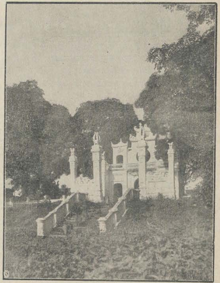
Hanoï. — De pagode van den „Groote Boeddha”.