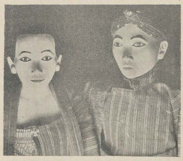
TWEE JAVAANSCH E POPPEN — in het poppenmuseum van het Beiersche stadje Neustadt, bij Coburg. Geschenk van een Duitscher op Midden-Java.