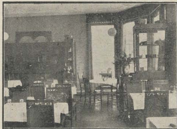
Kijkje in de fleurige, lichte beneden-toonzaal van Oost- en West-Indische Kunstnijverheid.