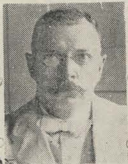
Oud-Voorzitter van den Volksraad.