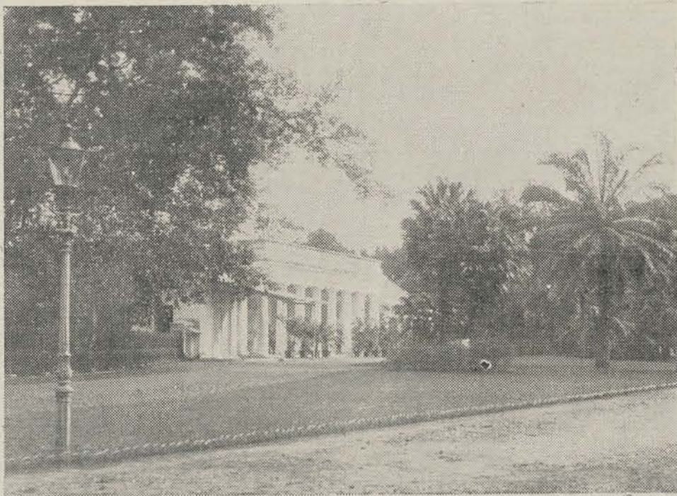
Het gebouw van den Volksraad, het voormalige paleis van den Legercommandant, in het Hertogspark te Batavia.