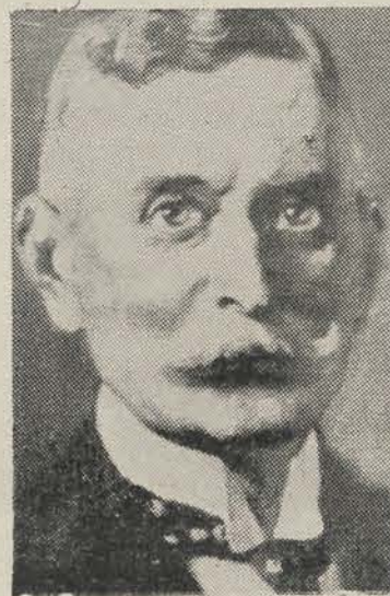
De eerste Voorzitter van den Volksraad.