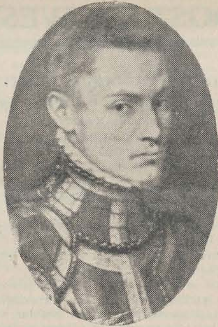
Jeugdportret van den Prins van Oranje.

niettemin van breeder historische beteekenis. Zoo goed als Colenbrander getuigt, dat hij een wereldvoorpost was voor het Protestantisme, zoo goed zegt Huizinga, dat de opstand der Nederlanden, dus de opstand van Oranje, het grootste wereldfeit der zestiende eeuw is geweest.