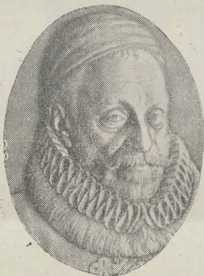
„De Vader des Vaderlands” 1533 — 24 April — 1933

Nederland en Indië hebben op indrukwekkende wijze den grooten Zwijger herdacht. Het moederland heeft „Willem-Vader” herdacht in een reeks van plechtige gebeurtenissen, in Delft, in Den Haag en Amsterdam en in vele steden en dorpen des lands.