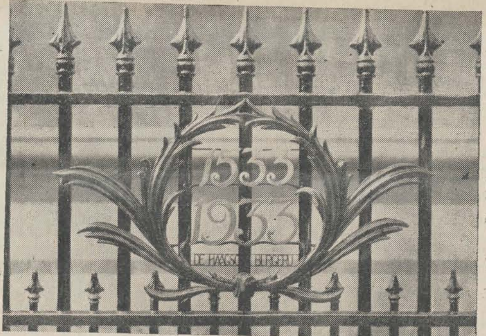
De ijzeren krans, gesmeed door den edelsmid Zwollo, die aan het hek van het Zwijger-standbeeld op het Plein in Den Haag op 22 April j.l. werd bevestigd.

En daarvoor danken wij, uit het diepst van ons hart, hier en in de Indiën en overal waar Nederlanders leven onder de dierbare kleuren van onze vlag den „Vader des Vaderlands“. Zoo moge het blijven zoolang ons volk sterk en zelfbewust zijn plaats onder de zon op aarde mag behouden.