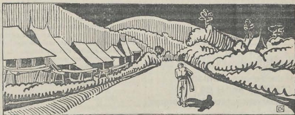
Uit: „Het Rijk van Bittertong”.

28 Jan. '32. Voordracht met lichtbeelden. Spreker: