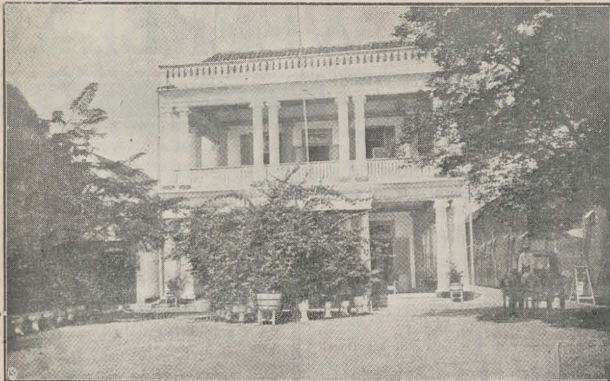
Het jongensweeshuis te Soerabaia.

getrokken, dat deze havenwerken als van enorme beteekenis werden beschouwd. Voor de vlucht welke Soerabaia's handel ook in de naaste toekomst ongetwijfeld nog nemen zal, was deze uitbreiding ook werkelijk noodig. De in aantal toegenomen scheepvaartverbindingen, vooral naar Australië, Amerika en Japan, de snelle groei van het goederenvervoer, eischten geheel up to date ingerichte haven-emplacements. Er is een machtig en grootsch werk daar aan den mond van de Kali Mas voltooid, voor Soerabaia en zijn achterland niet alleen, maar voor de welvaart van geheel Indië en in zekeren zin, — want een groot koloniaal belang is immers ook een Nederlandsch belang — voor het moederland ook van enorme beteekenis.