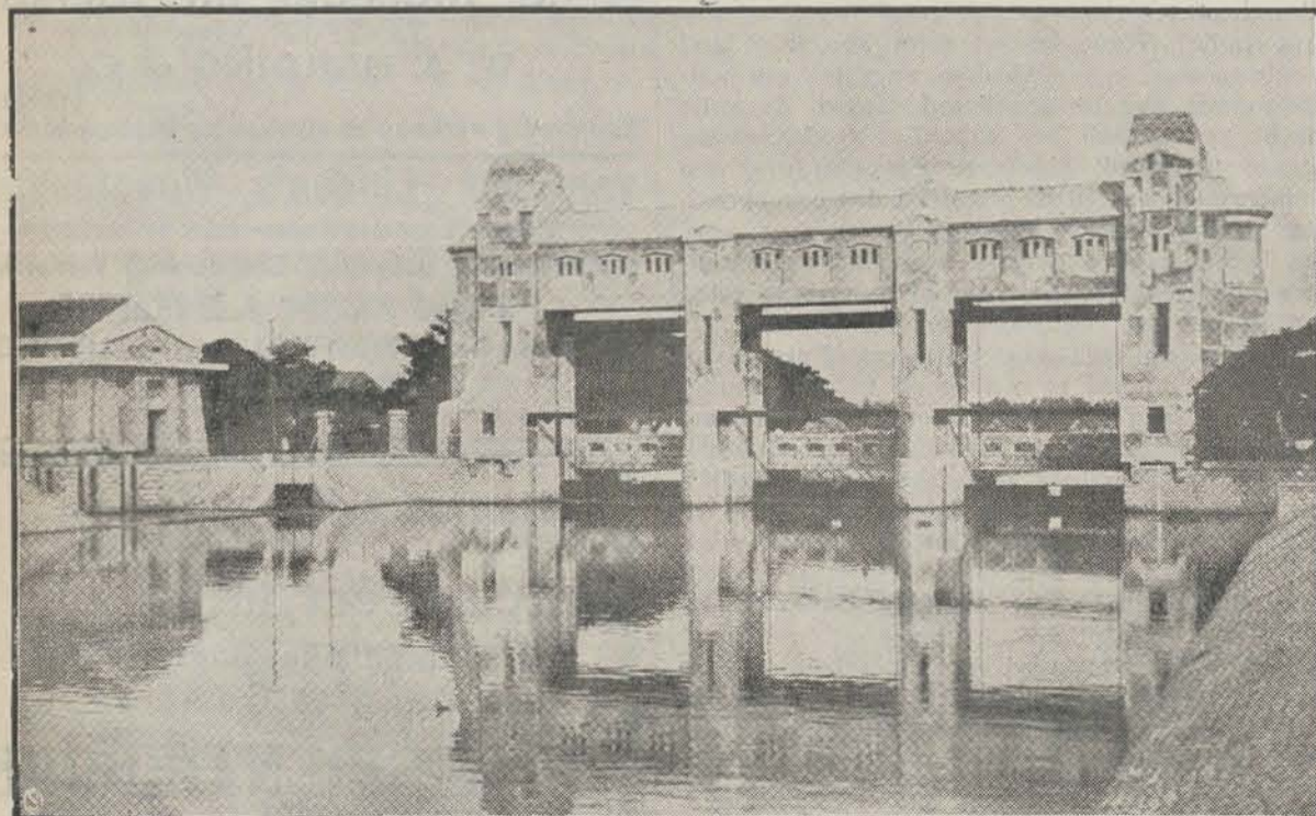
Bandjirsluis bij Wonókromo, in de onmiddellijke nabijheid van Soerabaia, aan de Brantas, waaraan ook Soerabaia is gelegen.

Op deze enorme havenemplacements zijn de pakhuizen en kantoren der verschillende groote stoomvaartmaatschappijen en prauwenveeren verzezen. Daar, op het meest Noordelijke plekje grond van Indië's eerste handelstad, liggen miljoenen aan producten opgestapeld in afwachting van den afvoer naar alle havens van de wereld. Zij liggen er binnen de wanden van uiterlijk weinig aantrekkelijke opslagplaatsen en de argelooze menschen, die een wandeling naar de haventerreinen van Tandjong Perak of, aan de overzijde van de Kali Mas, naar den historischen ouden Oedjong maken, hebben er geen idee van welke kolossale monumenten en tevens rijkdommen van hetgeen op Java gewerkt en geoogst wordt, hij voorbijtoert. Hier staan de groote loodsen van de oude bekende veemen, van het Strooioedenveem en van het Soerabaiaveem, terwijl ook de Staatsspoor er tegenwoordig groote pakhuizen heeft. Tusschen de haven en de stad is het verkeer ook reeds aanzienlijk verbeterd, zoodat, wanneer men te Soerabaia debarkeert, men zich onmiddellijk verplaatst ziet in het drukke havenverkeer, waar verscheidene groote oceanstoomers uit alle deelen der wereld laden en lossen, waar sporen op- en aanrijden en waar honderden havenkoelies bezig zijn, terwijl de groote kranen werken en de lucht vol is van harde geluiden, niet het minst van het hameren en stampen der groote machinefabrieken welke in de buurt gelegen zijn en van het groote dokbedrijf, dat werkt met drie dokken van 14000, 3500 en 1400 ton.