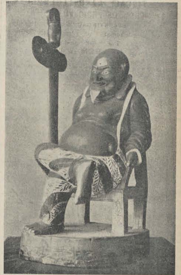
Houten beeld, tevens krishouder, Lombok. Serie 739 no's. 1 en 2. Zie p. 96.

Wij nemen een paar der illustraties van het boek hier over.