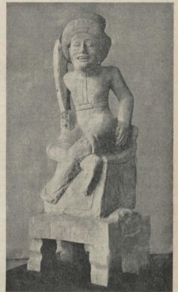
Steenen beeldje met houten voetstuk, Bali. Serie 740 no. 38. Zie p. 104.

Japansch, dan op het veel mooiere Singaparnawerk, hoewel de vlecht-slag, de „geringde”, dezelfde is, als de door den heer Jasper beschrevene.