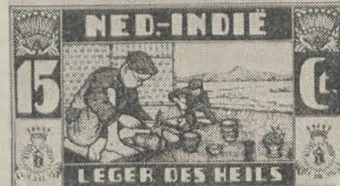
De weldadigheidspostzegels worden voor het gebruik gelijkgesteld met gewone Indische frankeerzegels en zijn geldig tot en met September 1933.