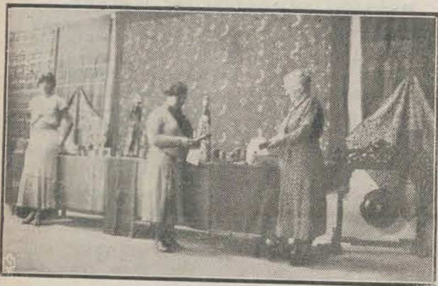
Kijkje op een der wanden van Boeatan's Tentoonstelling te Breda.

Voor menigen bezoeker — gedurende die 5 dagen telde de H.E.N.T. meer dan 10.000 betalende bezoekers — bleken deze kunst-uitingen ware verrassingen, die nu een blijvend indruk moeten hebben gemaakt. Jammer, dat de financieel zoo benarde tijds-omstandigheden maar weinig groote inkoopers schijnen te gedogen. Toch zijn er verscheidene der kijkers met een klein Indische souvenirje huiswaarts gegaan, zoodat Boeatan's deelname, welke natuurlijk héél wat moeite en kosten met zich heeft gesleept, toch als een voortreffelijke propaganda mag worden beschouwd. In de ruime, goed verlichte zaal kwamen, langs de wanden, de mooie ikat's en batik's goed uit, zooals bij onderstaand kiekje te zien is.