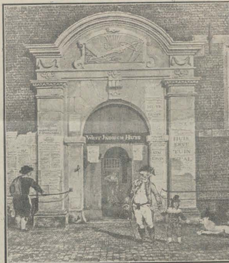
Poort van het West-Indische Huis. (Voormalige Voetboogsdoelen, Singel) Zetel der W.-I.-Compagnie No 1674

De ontzaglijke krachtsontwikkeling van de W.-I.-Comp. waarnaar duizenden in den lande reikhalzend hadden uitgezien, moge wel blijken uit het feit, dat van 1622 tot 1636 niet minder dan 547 schepen, groot en klein ter waarde van f 6.710.000 op den vijand veroverd werden, terwijl de ladingen der schepen, zoomede de in Brazilië gemaakte buit bij verkoop in Nederland ruim 30 miljoen gulden oprachten. In genoemde jaren werden daartoe dan ook ruim 800 vaartuigen met 67.000 matrozen en soldaten bemand, ten oorlog uitgerust en dat op een bevolking van wellicht niet meer dan 1½ miljoen