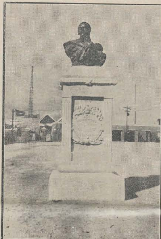
Standbeeld van Louis Brion te Willemstad, Curaçao. Den beroemden Curaçaoënaar Petrus Louis Brion, 1782—1821.

„Wat Uwe Exc. tot nu toe tot stand gebracht heeft in het belang van de oprichting van de Admiraliteit, is even belangrijk als verstandig. In handen van UEd. zal onze Marine spoedig eerbied afwringen, de Admiraliteit zal degelijk worden in-