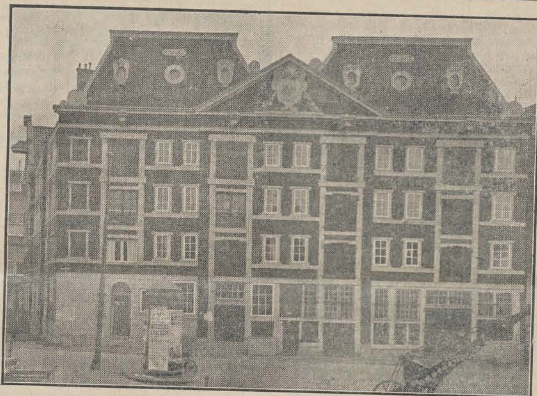
Het West-Indische Buitenhuis Zetel der W.-I.-Compagnie 1647—1674

Zelfs Suriname, in 1682 voor f 260.000 gekocht, werd aan de stad Amsterdam en de familie Van Aerssen in eigendom afgestaan. Zoo sukkelde men