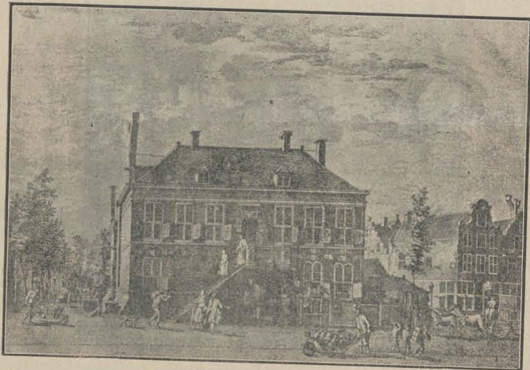
Het West-Indische Huis te Amsterdam

Verder is een aanvang gemaakt met de Algemeene Beschouwingen over de begroting voor 1933 in tweeden termijn, waarbij o.m. de heer Thamrin een voorstel indiende dat een verbod beoogt van