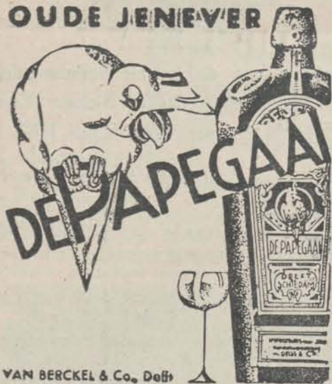
VAN BERCKEL & Co., Deft