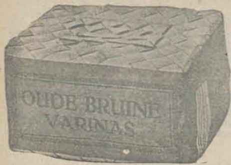
Inhoud 250 gram