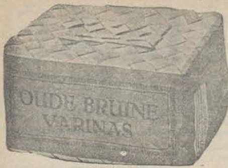
Inhoud 250 gram