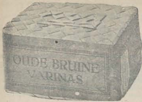
Inhoud 250 gram