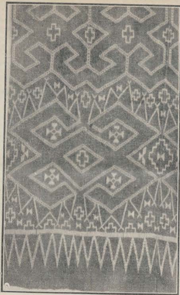
Ikatweefsel van Galoempang.

RADIO Radio-toestellen, direct op het lichtnet aan te sluiten (geén accu en anodebatterij), met ingebouwd luidspreker. Smaakvolle uitvoering in gepolitoerd notenhout. — Prijs f195.— UFRA-RADIO - UTRECHT Wittevrouwensingel 2 (5145) Tel. 16024