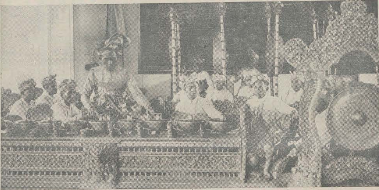
Het Gamelan-orkest dat op de Int. Kol. Tentoonstelling te Parijs, een vertooning zal geven en de Balineesche danseresjes zal begeleiden.