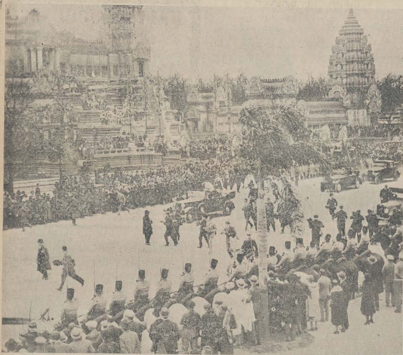
DE OPENING DER TENTOONSTELLING OP WOENSDAG 6 MEI J.L. De presidentiële stoet.