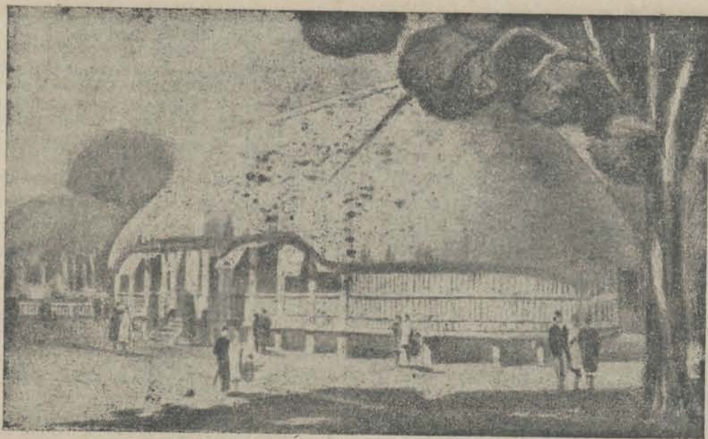
KOL. TENTOONSTELLING TE PARIJS. Een der paviljoens van België.

de Fransche kolonisators. Hét hart van Frankrijk klopt in het Oosten dicht naast het hart van Nederland. Spreker eindigde met de beste wenschen voor Nederland en zijn bewoners.