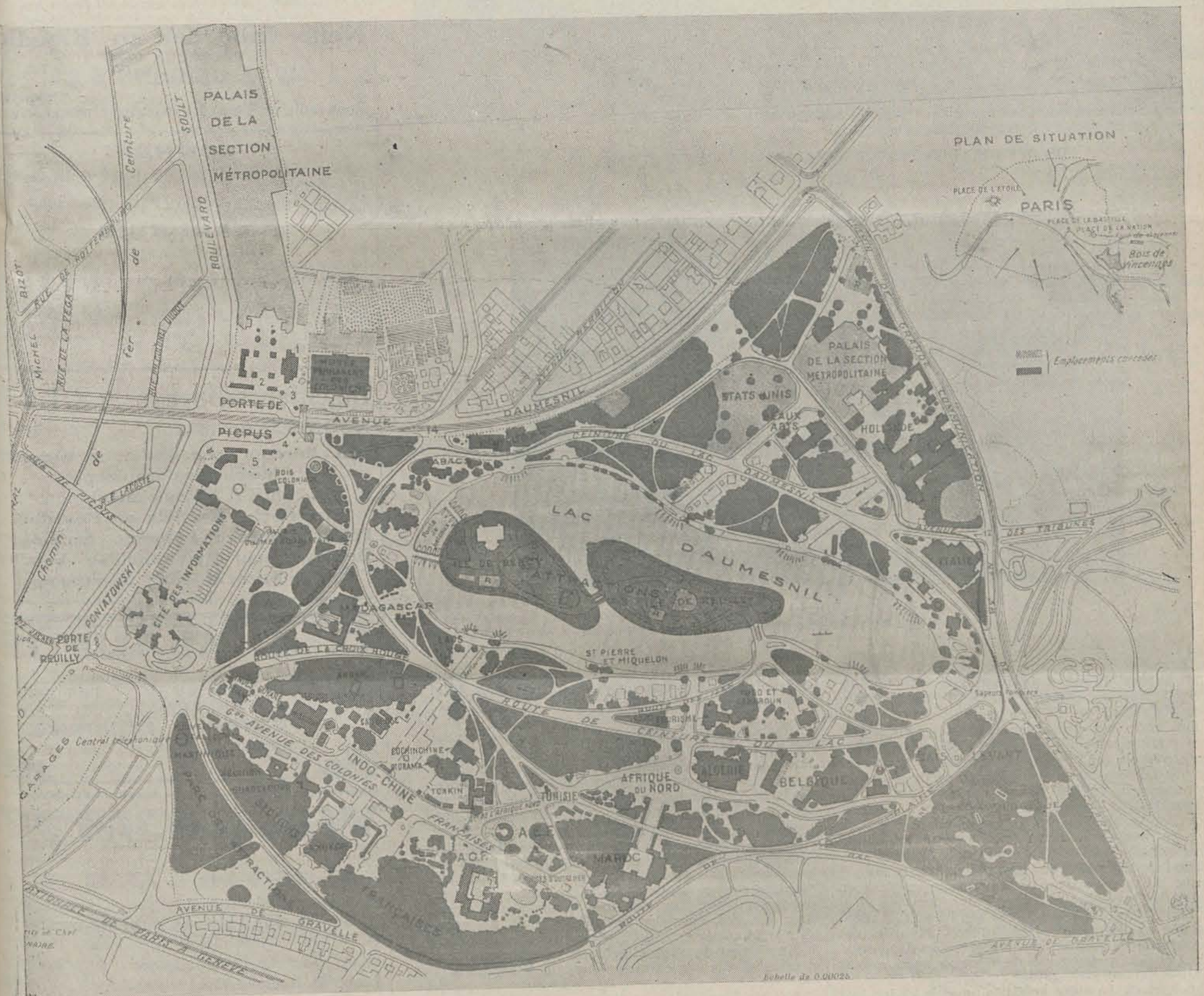
Bovenstaande plattegrond geeft een overzicht van de terreinen rondom het meer van Daumesnil in het bos van Vincennes, waar de groote koloniale tentoonstelling ingericht is, die van 7 dezer tot eind October duurt. De „wijken” der verschillende landen, haar onderlinge ligging en de voornaamste gebouwen zijn op bovenstaande teekening aangegeven.