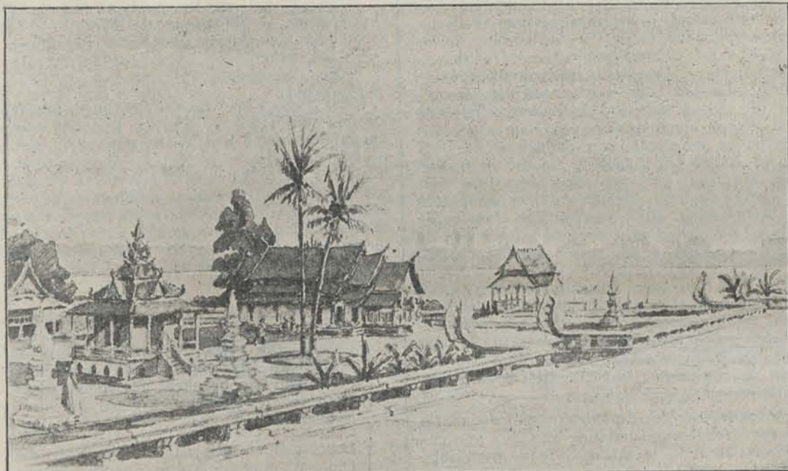
Het Laos-paviljoen in de afdeling Indo-China. — Architect Blanche.