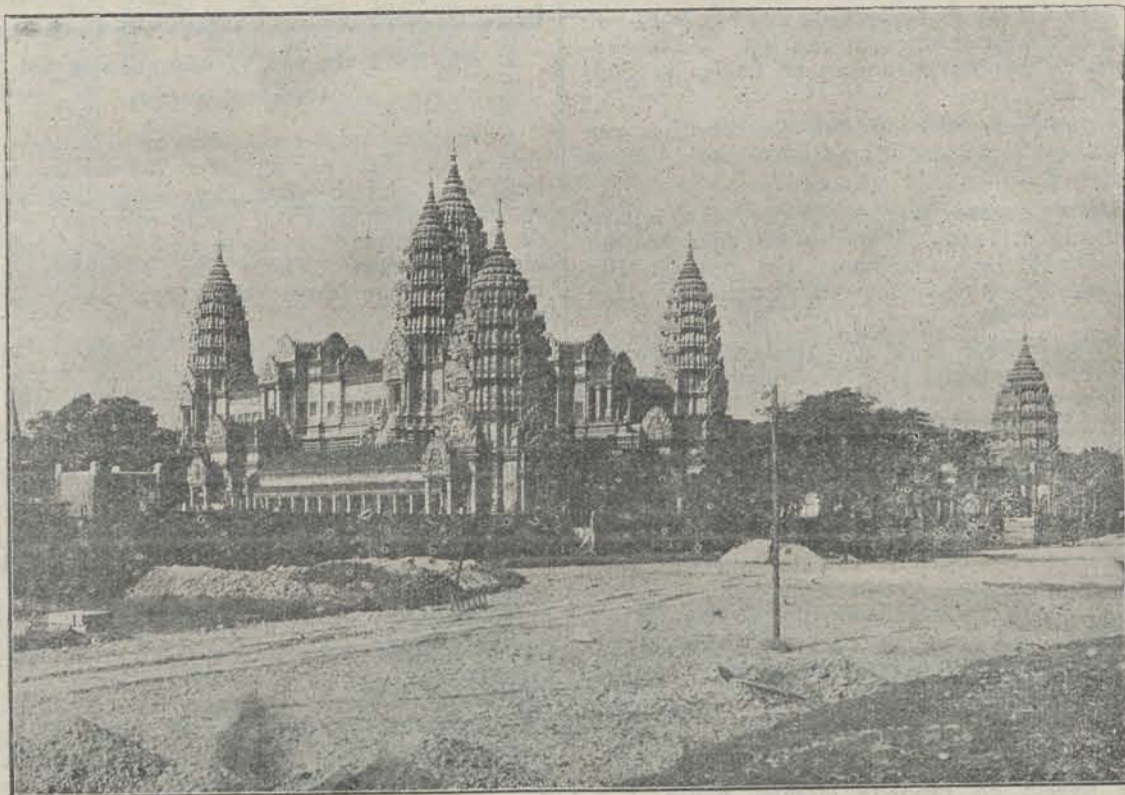
Het in aanbouw zijnde paviljoen van Indo-China, een getrouwe reproductie van den beroemden tempel van Angkor-Vat. — Architect Blanche.