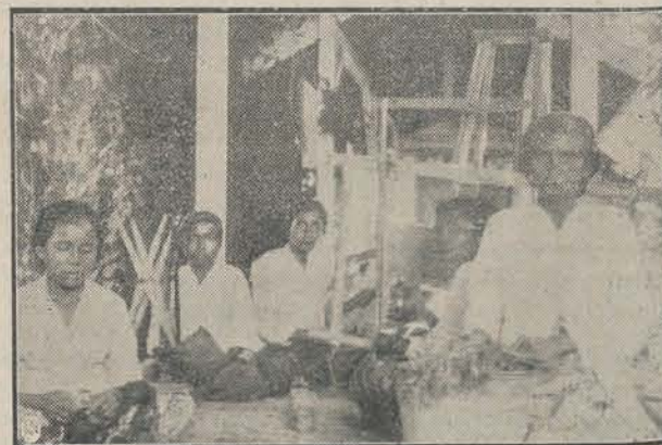
„BOEATAN-WEEFSCHOOL OP ALOR“.