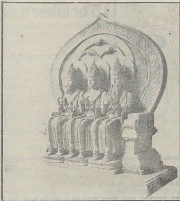
H. DRIEVULDIGHEID (H. Geest in het midden.)