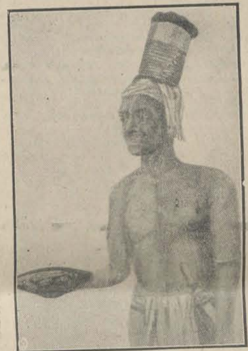
Het aanbieden van de sirih-pinang .

Als de oudelui het over den bruidsschat eens zijn, wordt het officieele aanzoek gedaan. Dit bestaat uit het aanbieden van de sirih-pinang aan de ouders van het meisje.”