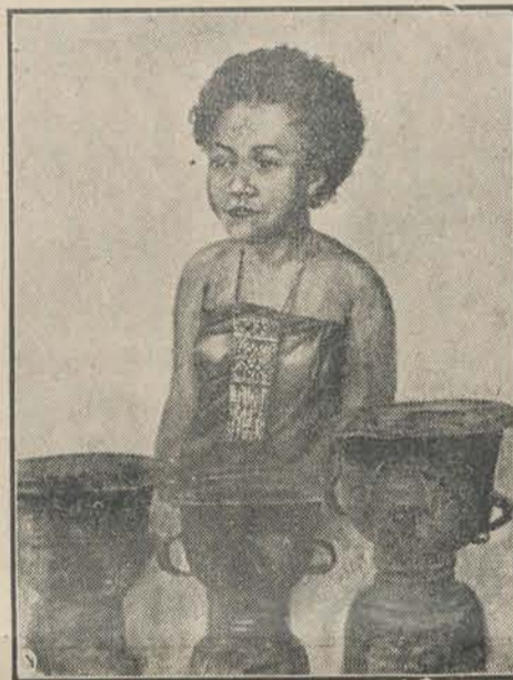
Aloreesch meisje; op den voorgrond eenige „Mokko's”

„Daar zijn ze tot vóór een twintigtal jaren nog het eenige ruilmiddel geweest.