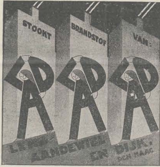
DE RIEMERSTRAAT 184 DEN HAAG :: TELEFOON 33984