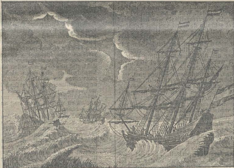
Compagnies-schepen in den storm!

Men kent natuurlijk de vele namen van hen, die de tijd der Compagnie den grondslag hebben d van de Nederlandsche koloniën in den In- nen Archipel. Het is overbodig deze helden te