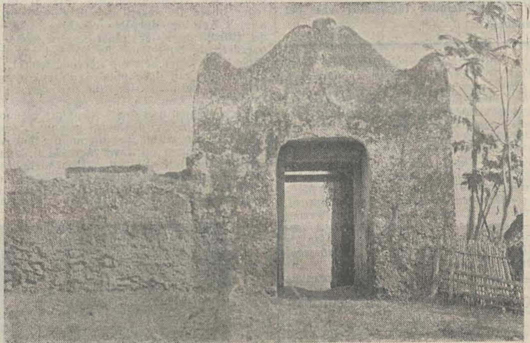
Kratonpoort te Baoe-Baoe.

DEN HAAG · STADHOUDERSPLEIN 3 · TEL. 52594 Amsterdam: N.-Witsenstraat 3, v.-Baerlestraat 13; Rotterdam: N. Binnenweg 167; Groningen: O. Ebbingestraat 18