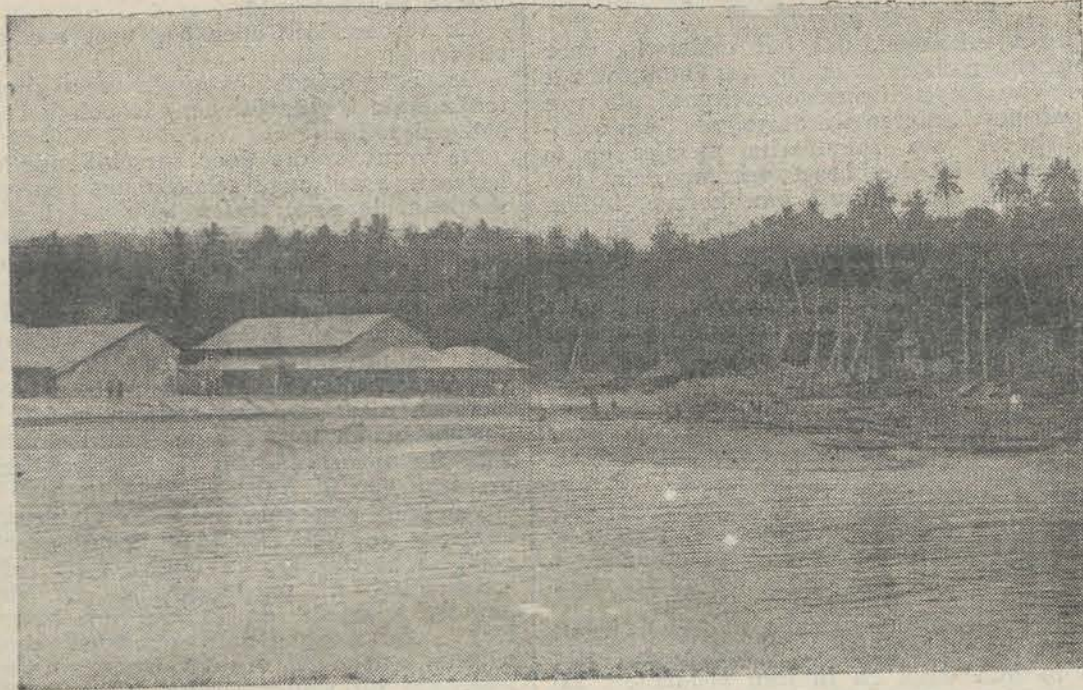
Passer te Baoe-Baoe.

Meldt U aan voor het lidmaatschap. (Adres Secreta- riaat: Korte Voorhout 6, Den Haag).