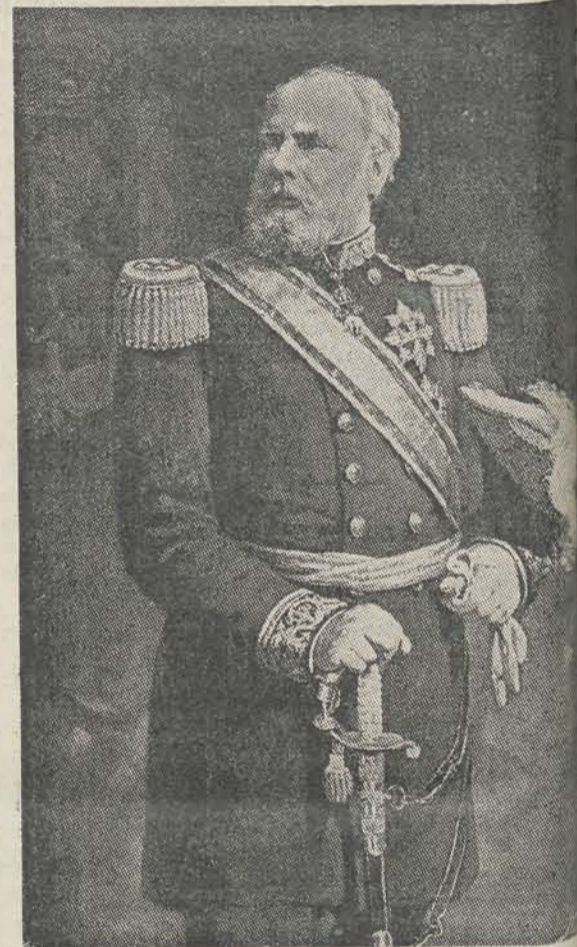
Z. M. Koning Willem III.

— hoewel waarschijnlijk niet altijd zonder met zich zelf en zijn Ministers — de Koning goed heeft vervuld. Moeilijker oogenblikken doorleefd ten opzichte van de buitenlandsche politiek. Want het tijdperk Zijner Regeering men met de krachtproef van Von Bismarck het verbrokkelde Duitschland ferro et ignis