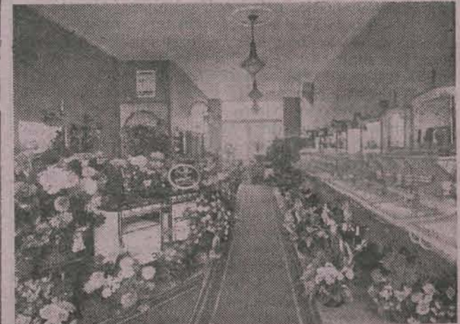
Interieur bij opening met bloemen, waaronder veel bloemstukken van cliënten.

Voor hen, die te Amsterdam bekend zijn, heeft de naam ter Schiphorst geen vreemden klanck. Het is een naam, die in het loodgieters- en sanitair bedrijf van vader op zoon is gegaan en zich in den loop der jaren