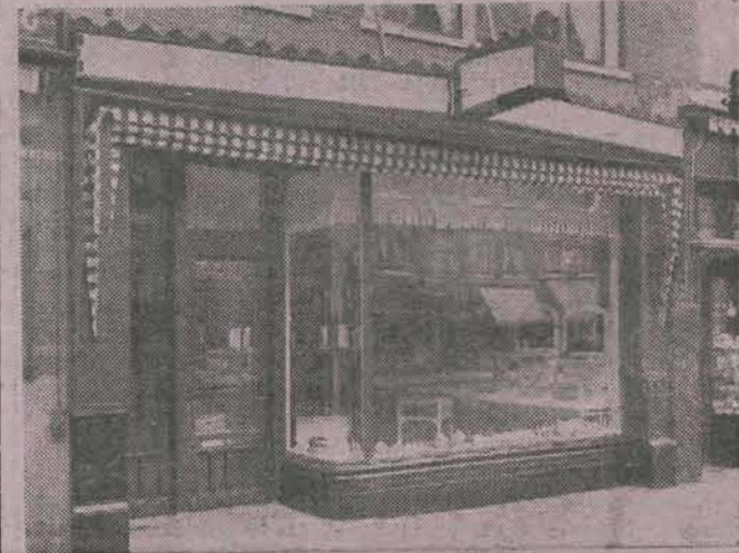
Het front der Zaak.

Het is vaak zeer moeilijk voor repatrieerenden bij aankomst in Holland een leverancier te kiezen, die juist aan de eischen kan voldoen, welke meer spe-