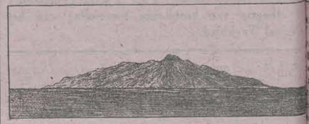
Paloeueh van het N.O. gezien.

eiland, welke thans op eens actueel zijn geworden en voor zoover we weten nog door geen nadere schrijving van beteekenis gevolgd zijn. De Zeemansgids van den O.-I. Archipel 3) — bron die meermalen gegevens verschaft wanne bijv. de Encyclopaedie van Ned.-Indië ons in de steek laat — vermeldt over Paloeueh o.m. het volgende: Het is een hoog eiland, dat aan alle zijden dicht genaderd kan worden. Het bestaat uit een half kalen, half begroeiden, ronden, vlakken bergtop, die naar alle zijden uitloopers naar de kusten zendt, welke aan de Noordzijde grootendeels ontwoond zijn. Op de ontwoode gedeelten staan veel lontarpalmen, slechts bij de kampongs ziet men klappers. De bewoners zijn bekwame zeevaarders en staan op de geheele Noordkust (van Flores) bekend als visschers, smokkelaars en handelaars. Zij zijn vrijmoedig van aard en nog zeer onbeschaafd. Er zijn talrijke kampongs, 4) die elk hun eigen gebied hebben, dat door anderen dan de inwoners zorgvuldig gemedend wordt. De grotere en verreweg belangrijkste kampong Mage, ligt op de Noordkust. De N.-W. kant kenmerkt zich nog door opvallenden, vlak bij zee steil afgestorten bergrug. Even daar bez. is een kleine baai, de Laboe Bokko. De Zuidkust van het eiland is over algemeen steiler, woester en meer begroeid dan de Noordkust. Op de laatste vindt men geleidelijk hellingen, welke kaler en meer bebouwd zijn.