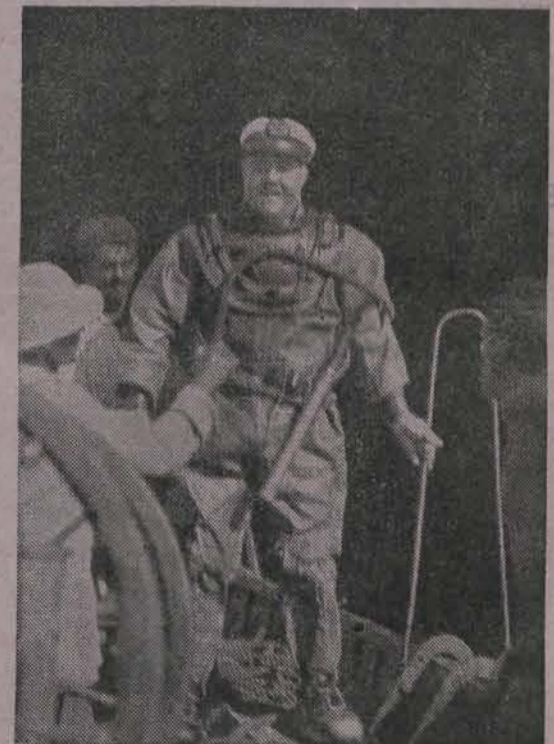
Op het eiland Perim.

sloot „naar beneden“ te gaan om alles zoo goed mogelijk te controleeren. Onder groote belangstel- ling stak hij zich in een duikerpak, liet zich de noodige aanwijzingen geven hoe zich in zoo'n zeer ongewoon kledingstuk te gedragen, waarmede hij in het water dook. We waren allen blij, toen wij na een tijdje van spannend wachten den helm boven water zagen komen, omdat een dergelijk experi- ment heelemaal niet zonder gevaar is. Het onder- zoek in loco had aangetoond, dat alles in orde was, tenminste voor zoover men daartoe uit een onder- zoek onder ongunstige omstandigheden mocht be- sluiten. Geconstateerd werd er nog, dat ook het derde blad een flinken klap had gehad. Vermoede- lijk heeft de schroef ergens in een haven tegen een hard voorwerp geslagen.