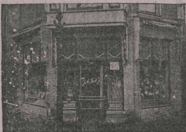
INDISCHE INGREDIENTEN Special. in Fijne Vleeschwaren, Koek, Bisquit, Chocolade