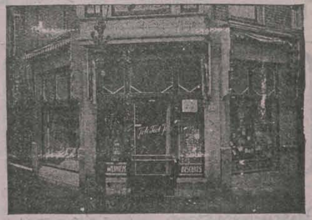
INDISCHE INGREDIËNTEN Special. in Fijne Vleesohwaren, Koek, Bisquit, Chocolade