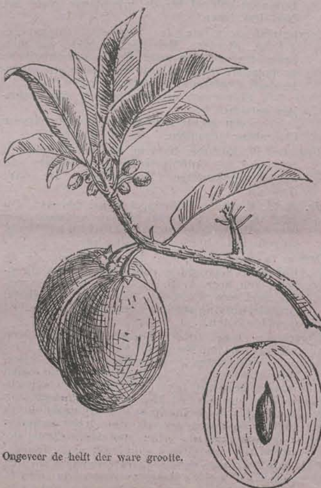
Ongeveer de helft der ware grootte.

proef zal genomen worden met de z.g. Sawoe manila. Een bepaalde hoeveelheid dezer vruchten zal door verschillende groenten- en fruithandelaren onder eenigen van hun cliëntèle worden verdeeld, met het verzoek van hun bevinding mededeeling te willen doen.