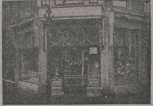
INDISCHE INGREDIËNTEN Special. in Fijne Vleeschwaren, Koek, Bisquit, Chocolade