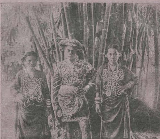
Hoofd uit Galoempang met familie.

U kunt mij herinneren aan het Jav. kembang en het Maleische boenga en men zou gaan twijfelen aan de autoriteit van Klinkert, indien er niet in de Maleische taal verschillende namen voorkwamen,