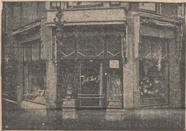
INDISCHE INGREDIËNTIEN Special. in Fijne Vleeschwaren, Koek, Bisquit, Chocolade