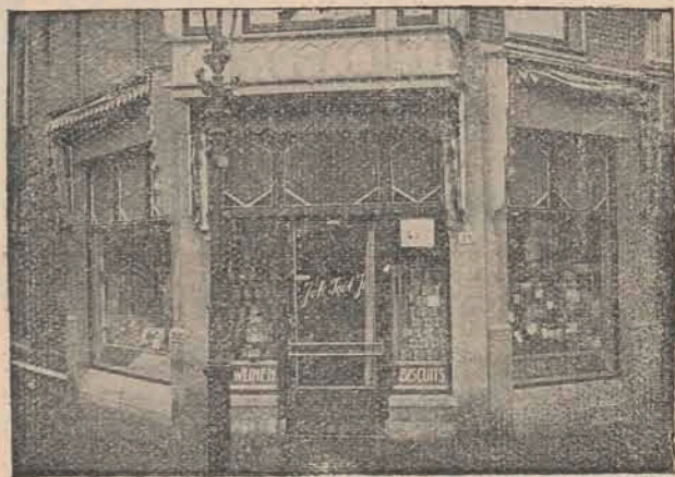
INDISCHE INGREDIËNTEN Special. in Fijne Vleesohwaren, Koek, Bisquit, Chocolade

JOH. TOET - 'S-GRAVENHAGE Comestibles - Delicatessen - Kruidenierswaren AERT VAN DER GOESSTRAAT 34 - TELEFOON 51561