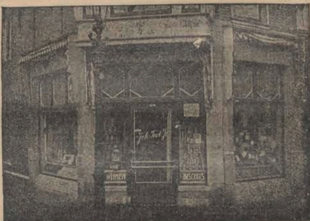
INDISCHE INGREDIENTEN Special. In Fijne Vleeschwaren, Koek, Bisquit, Chocolade

Comestibles - Delicatessen - Kruidenierswaren AERT VAN DER GOESSTRAAT 34 - TELEFOON 51561