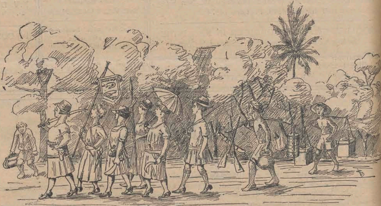
Dames, in 't Geweer!