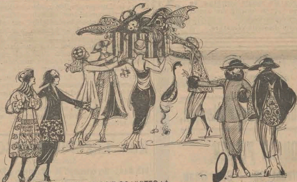
TOUTE FEMME ELEGANTE SE DOIT DE VISITER LA COLLECTION DE ROBES, COÛTURES, MANTEAUX, CHAPEAUX, ETC. DE

Wanneer ik over dit onderwerp in het „K. W.“ van 17 No. 38 schreef, heeft men in Indië niet stil zitten en is er uit de toen reeds bestaande roerigheid uit het zoeken naar een succes belovenden in het streven naar het doen van degelijk werk de grondslagen, in 1920 iets voortgekomen. De moeite waard is om erbij stil te staan en nader te bezien. In militaire en spoorwegkringen zijn er eerste stappen van gedaan, die gedeeltematig gefaald hebben; in die van Boeddi Oetomo van den Sarikat Islam — het Comité-Weerbaar Nederland — had men er hooge verwachtingen van; maar men bleek bij deze laatste of scheppingsbekwaam, of waar „nesten“ werden gevonden door vogels van die en soortgelijke pluivers, is men hier halverwege blijven steken in de maatregelen, daar was maar al te vaak ge-