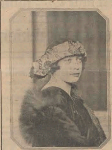
Model Voorjaar 1921

Protectie van voornaamste H. H. Medici hier te lande