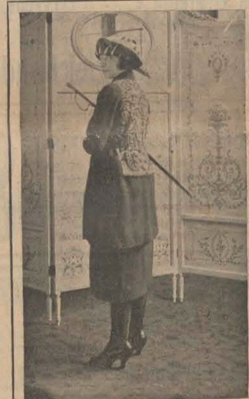
Model Voorjaar 1921

Waarna de vertooning der films een aanvang nam. Zoals te verwachten was, wyl bekend, toonde zich de heer Giel, bij de uitlegging, wederom te zijn een vertrouwd mentor die, ofschoon gebonden aan beperking, niettemin de kern van het onderwerp op even leerzame en onderhoudende