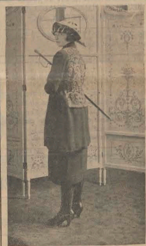
Model Voorjaar 1921