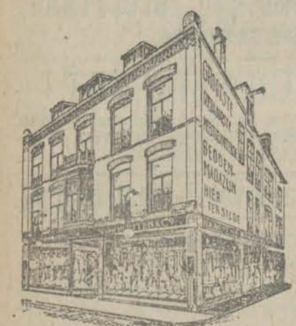
Opgericht Ao 1781

Groote sorteering Slaapkamer - Ameublementen