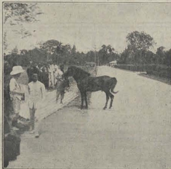
De hoofdweg te Kaban-Djahé.

Bijgaand kiekje is te Kaban Djahé zelf genomen,