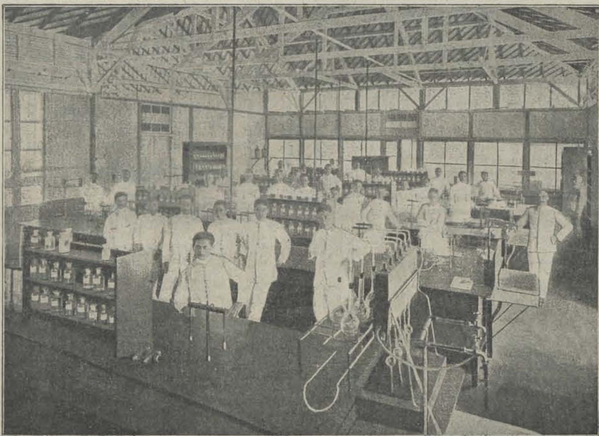
In het Laboratorium der Suikerschool van den Suikerbond.

nen om huizen te bouwen van f 100 huur, die grif weggaan, maar — volgens den heer L. in „De Indiër — is dit een verkeerd verschijnsel, „huizen van een honderd gulden zijn die over het algemeen niet waard en men betaalt hier abnormaal hoge huren, ook in die groepen, voor weinig comfort.” Vergelijkt men deze met die van huizen in andere landen, dan valt de vergelijking in het nadeel van ons uit.