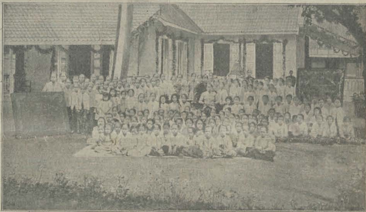
De nieuwe Kartinschool „Kenjo Pinardi“ te Toeloengagong.

in Nederland verschenen weekbladen, uitsluitend aan koloniale belangen gewijd en in dien tijd is ons motio: „ Het Koloniaal belang is een algemeen Ne- derlandsch Belang “ meer en meer doorgedrongen tot de massa van ons volk. Meer en meer komen in Ned- Indië instellingen tot stand in het belang van ont- wikkeling en opheffing der Inlanders. Dit getuigen ook de ondervolgende kiekjes.*)