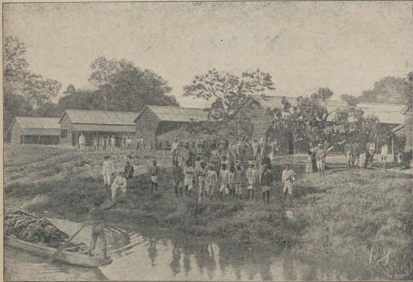
Immigranten-woningen op een Surinaamsche plantage.

„het daer soo sterck gewoon is te regenen, dat het „Landt door den overvloed des waeters bijna onbruikbaar is, soo heeft integendeel den tijt, dat de onse „aldaer hebben verkeert, soo schoon en drooch weder „geweest, dat sommige onder de Engelse dit merkende, „Godt lasterlyck seiden: Dat Godt niet meer Engels „maar geheel Zeeuws was geworden”.