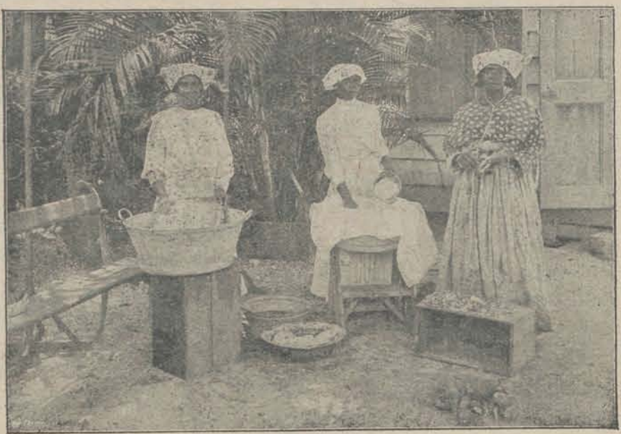
Gomma-bereiding. (Gomma is stijfisel uit casave bereid.)

in den Haag en Amsterdam en Rotterdam weten dat Suriname bestaat — en maar last bezorgt, neen, dóórdringen moet het tot geheel de natie, die medeverantwoordelijk is. Onkunde mag geen verontschuldiging zijn. Reeds te lang leefde men in onkunde. En vooral nu is de